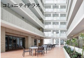
※建物竣工写真 2014年2月撮影(外観、エントランス、コミュニティテラス等)