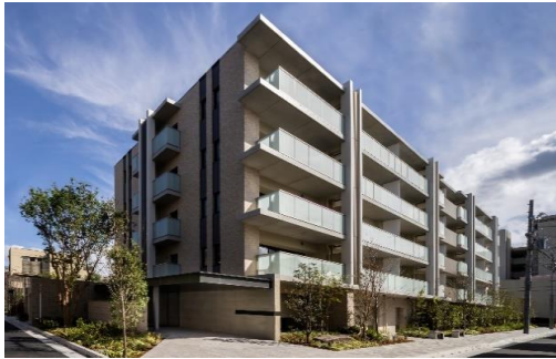
■建物写真 芦屋の静寂と自然美、上質感に抱かれる邸宅