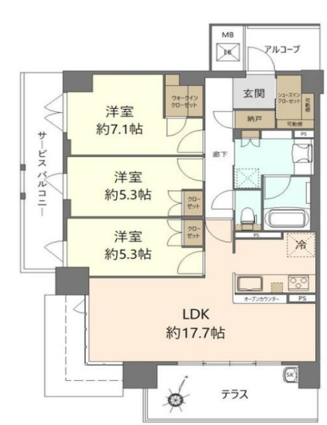
■間取り図 80㎡超のゆとりのある”3LDK”